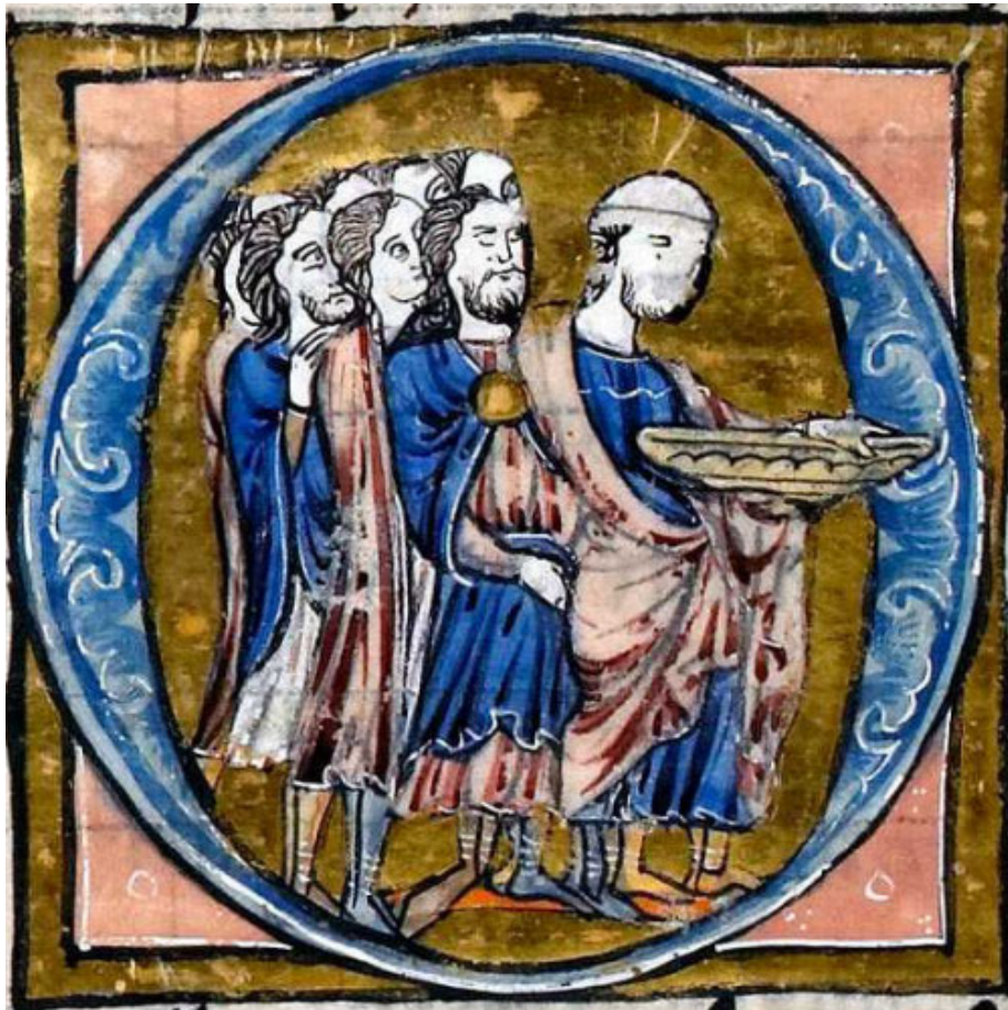
Joseph d'Armathie et ses compagnons emportant le Graal de Palestine

Transports : liaisons quotidiennes depuis Paris-Bercy jusqu'à Sermizelles-Vézelay, durée moyenne 2h30. Bus de Sermizelles à Vézelay (9km) pour certains trains. Nous consulter pour les horaires ou s'adresser à l'office du tourisme vezelay@destinationgrandvezelay.com