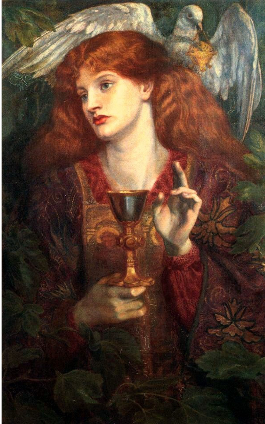
Dante Gabriel Rossetti, la demoiselle du Saint-Graal (1874)