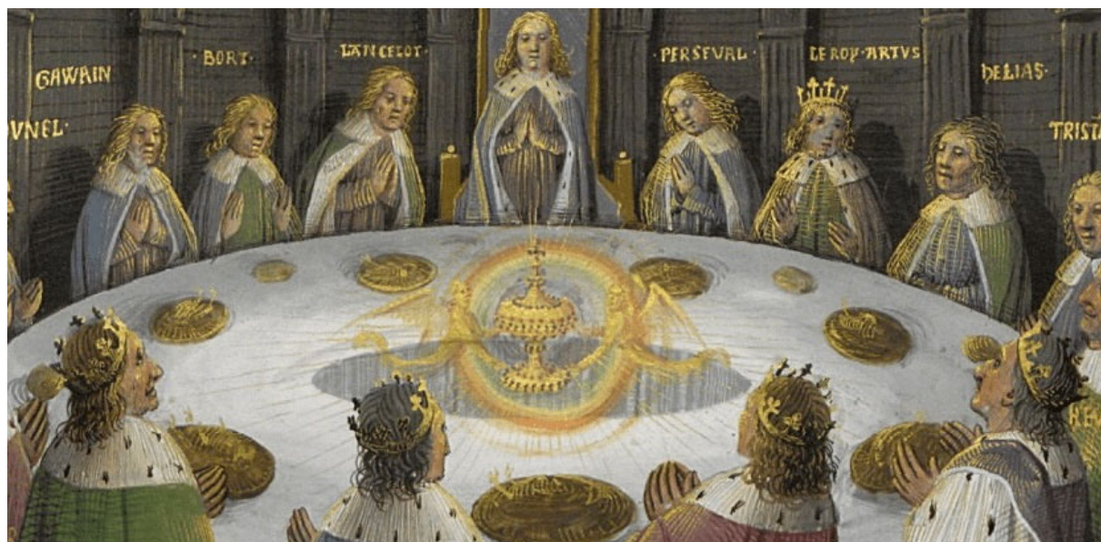
Le Roi Arthur et les chevaliers de la Table Ronde réunis autour du Graal

Accompagné d'une lecture symbolique de la Madeleine de Vézelay