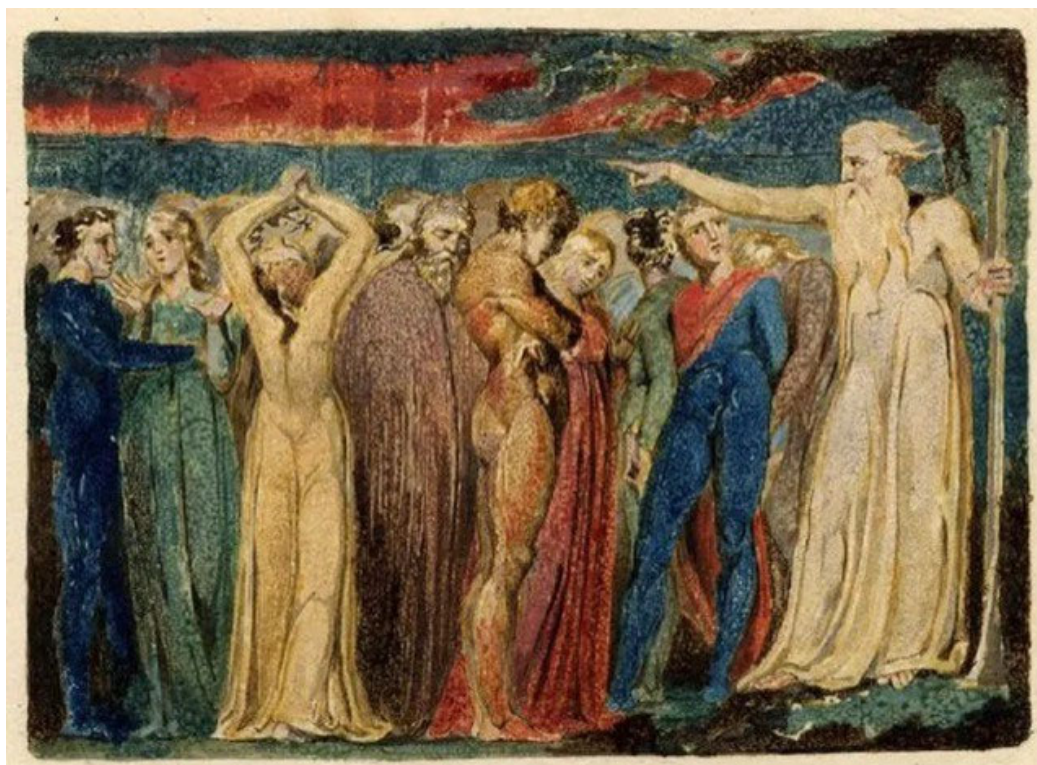
William Blake, Joseph d'Arimathie prêchant aux Britanniques (1794)

Vendredi 6 décembre 15h-19h, Samedi 7 décembre 9h -12h et 13h30 – 18h30, Dimanche 8 décembre 9h-12h et 13h30 -17h